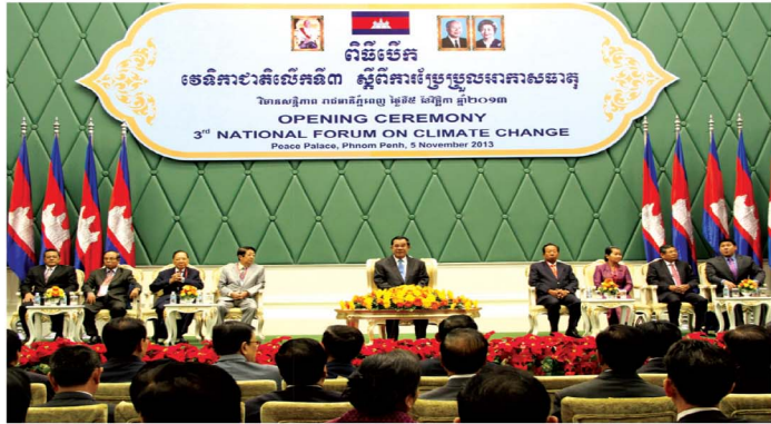
សម្តេចអគ្គមហាសេនាបតីតេជោ ហ៊ុន សែន នាយករដ្ឋមន្ត្រីនៃព្រះរាជាណាចក្រកម្ពុជាបានអញ្ជើញចូលរួមជាអធិបតីខ្ពង់ខ្ពស់ក្នុងពិធីបើកវេទិកាជាតិលើកទី៣ ស្តីពីការប្រែប្រួលអាកាសធាតុ ឆ្នាំ២០១៣

កម្ពុជាជាប្រទេសអភិវឌ្ឍន៍តិចតួច និងមានសមត្ថភាពបន្តទាប ពោលគឺងាយរងគ្រោះបំផុតពីការប្រែប្រួលអាកាសធាតុ។ នៅក្នុងរយៈពេល ២០ ឆ្នាំ (១៩៨៧-២០០៧) កម្ពុជាបានរងគ្រោះដោយទឹកជំនន់ធ្ងន់ធ្ងរ ចំនួន១២ លើកដែលបានសម្លាប់មនុស្ស ១.១២៥នាក់ និងបង្កការខូចខាត មានតម្លៃជាទឹកប្រាក់ ៣២៧លានដុល្លារ។ លើសពីនេះគ្រោះរាំងស្ងួត ៥លើក បានកើតឡើងក្នុងតំបន់នានានៃផ្ទៃប្រទេស បានប៉ះពាល់ដល់ ប្រជាជន៦,៥លាននាក់ ដោយខូចខាតជាទឹកប្រាក់សរុប ១៣៨លាន ដុល្លារ (SNC, 2012)។ ព្យុះកេតសណាណៅឆ្នាំ២០០៩ បានសម្លាប់ ប្រជាជនចំនួន៤៣នាក់ និងបង្កការខូចខាតជាទឹកប្រាក់១៣២លានដុល្លារ (NCDM, 2010)។ នៅឆ្នាំ២០១១ គ្រោះទឹកជំនន់បានសម្លាប់ ប្រជាជន២៥០នាក់ និងបង្កការខូចខាតជាទឹកប្រាក់៥២០លានដុល្លារ (NCDM, 2011)។ ជំនន់ទឹកភ្លៀង និងទន្លេមេគង្គឆ្នាំ២០១៣បណ្តាល ឱ្យមានមនុស្សស្លាប់១៦៨នាក់ និងប៉ះពាល់ដល់ការរស់នៅរបស់ ពលរដ្ឋសរុបប្រមាណ ១,៨លាននាក់ (NCDM, 2013)។