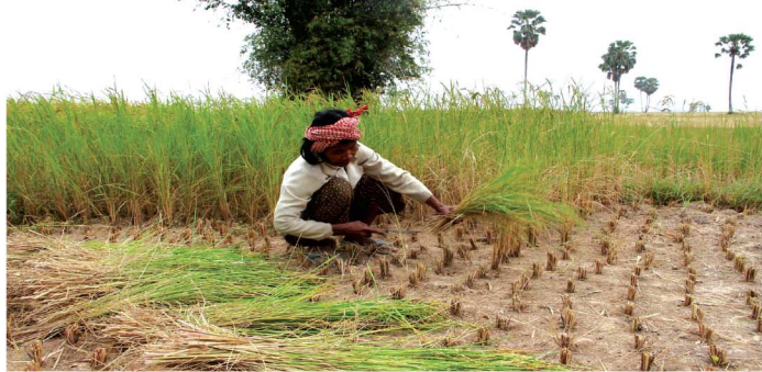
ការពង្រឹងស្មៅ បានធ្វើឱ្យកសិករបង្កើនចិត្តច្រូតស្រូវមកធ្វើជាចំណីសត្វ

កម្ពុជាជាប្រទេសអភិវឌ្ឍន៍តិចតួច និងមានសមត្ថភាពបន្តទាប ពោលគឺងាយរងគ្រោះបំផុតពីការប្រែប្រួលអាកាសធាតុ។ នៅក្នុងរយៈពេល ២០ ឆ្នាំ (១៩៨៧-២០០៧) កម្ពុជាបានរងគ្រោះដោយទឹកជំនន់ធ្ងន់ធ្ងរ ចំនួន១២ លើកដែលបានសម្លាប់មនុស្ស ១.១២៥នាក់ និងបង្កការខូចខាត មានតម្លៃជាទឹកប្រាក់ ៣២៧លានដុល្លារ។ លើសពីនេះគ្រោះរាំងស្ងួត ៥លើក បានកើតឡើងក្នុងតំបន់នានានៃផ្ទៃប្រទេស បានប៉ះពាល់ដល់ ប្រជាជន៦,៥លាននាក់ ដោយខូចខាតជាទឹកប្រាក់សរុប ១៣៨លាន ដុល្លារ (SNC, 2012)។ ព្យុះកេតសណាណៅឆ្នាំ២០០៩ បានសម្លាប់ ប្រជាជនចំនួន៤៣នាក់ និងបង្កការខូចខាតជាទឹកប្រាក់១៣២លានដុល្លារ (NCDM, 2010)។ នៅឆ្នាំ២០១១ គ្រោះទឹកជំនន់បានសម្លាប់ ប្រជាជន២៥០នាក់ និងបង្កការខូចខាតជាទឹកប្រាក់៥២០លានដុល្លារ (NCDM, 2011)។ ជំនន់ទឹកភ្លៀង និងទន្លេមេគង្គឆ្នាំ២០១៣បណ្តាល ឱ្យមានមនុស្សស្លាប់១៦៨នាក់ និងប៉ះពាល់ដល់ការរស់នៅរបស់ ពលរដ្ឋសរុបប្រមាណ ១,៨លាននាក់ (NCDM, 2013)។