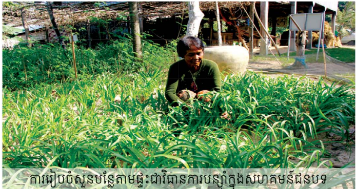
ការរៀបចំសួនបន្លែតាមផ្ទះជាវិធានការបន្សុំក្នុងសហគមន៍ជំនប់ទេរ

ពង្រឹងសមត្ថភាព គ.ជ.គ.ប.អ. ដើម្បីកៀរគរ និងចាត់ចែងមូលនិធិប្រែប្រួលអាកាសធាតុឱ្យមានប្រសិទ្ធភាព និងដើម្បីត្រៀមខ្លួនសម្រាប់គ្រប់គ្រងមូលនិធិប្រែប្រួលអាកាសធាតុថ្នាក់ជាតិ។