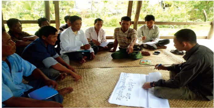
ការពិភាក្សាក្នុងក្រុមគោលដៅ ដើម្បីសិក្សាប្រមូលព័ត៌មានសម្រាប់ការប្រើប្រាស់ផល អនុផលព្រៃឈើ ( ថតដោយគម្រោង CFO ឆ្នាំ ២០១២ ទទួលមូលនិធិពី CCCA វគ្គទី ១ )

កម្មវិធី CCCA ត្រូវបានបង្កើតឡើងមានភាពបត់បែន និងច្នៃប្រឌិតសម្រាប់ដោះស្រាយ និងឆ្លើយតបទៅនឹងបញ្ហាប្រែប្រួលអាកាសធាតុ និងការប្រឈមហានិភ័យគ្រោះមហន្តរាយក្នុងប្រទេសកម្ពុជា ជាលក្ខណៈប្រព័ន្ធ និងប្រកបដោយប្រសិទ្ធភាព។ គោលបំណងរបស់ CCCA គឺពង្រឹងសមត្ថភាពរបស់ គ.ជ.គ.ប.អ. ដើម្បីអនុវត្តការកិច្ចរបស់ខ្លួនក្នុងការដោះស្រាយបញ្ហាប្រែប្រួលអាកាសធាតុ និងអាចឱ្យក្រសួងពាក់ព័ន្ធនិងអង្គការសង្គមស៊ីវិលអនុវត្តសកម្មភាពចម្បងៗពាក់ព័ន្ធនឹងការប្រែប្រួលអាកាសធាតុ។